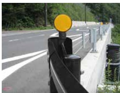
景観色デリネーター