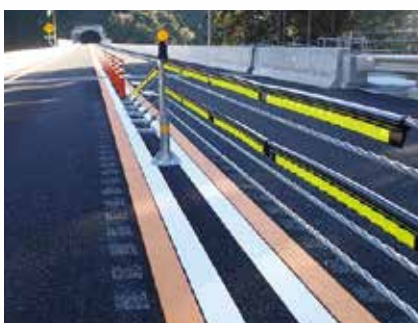
ワイヤーロープ向け保安用品