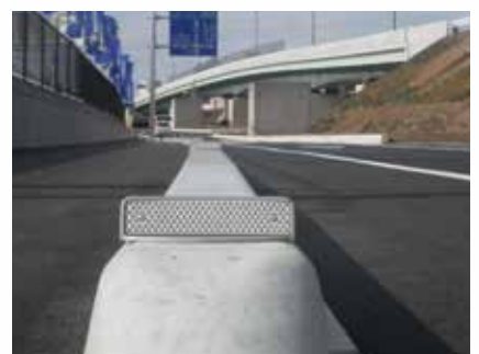
縁石 (アルミ製脚付)