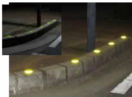
縁石 (樹脂製・貼付式)