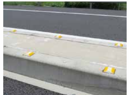
縁石 (樹脂製・貼付式)