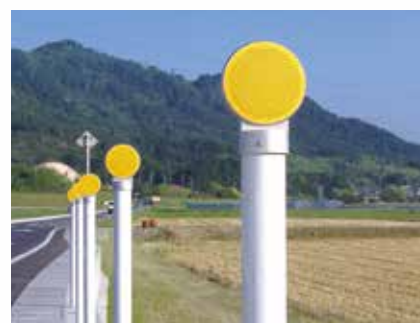
コンクリート建込式