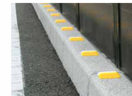
縁石 (樹脂製・貼付式)