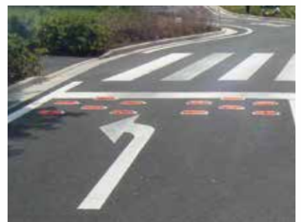
停止線 (アルミ製脚付)