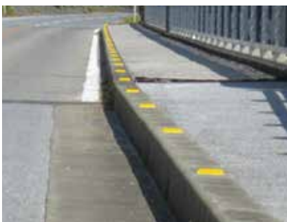
縁石 (樹脂製・貼付式)