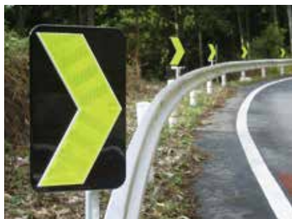
アクリルレンズ式