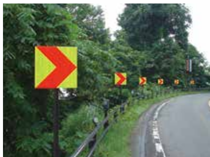
アクリルレンズ式