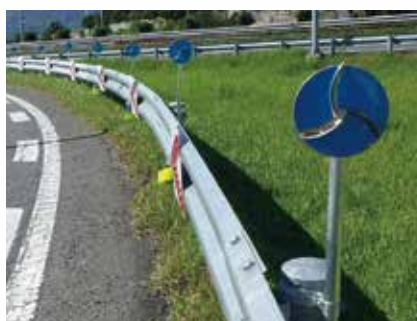
大型 (防塵) 式