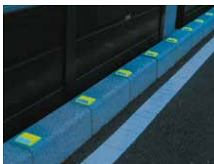
縁石（樹脂製・貼付式）