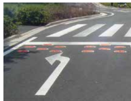
停止線（アルミ製脚付）