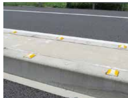
縁石（樹脂製・貼付式）