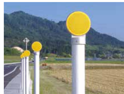
コンクリート建込式