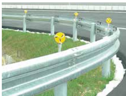
ガードレール (防塵) 式