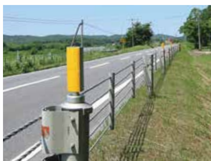
かぶせ (角型) 式