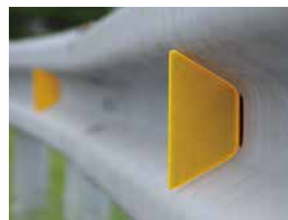
ガードレール差込 (台型) 式