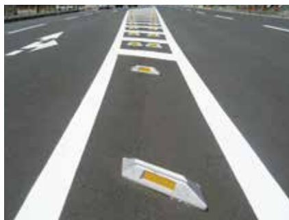
センターライン（アルミ製脚付）