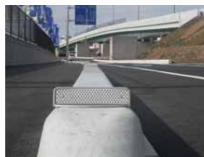
縁石（アルミ製脚付）