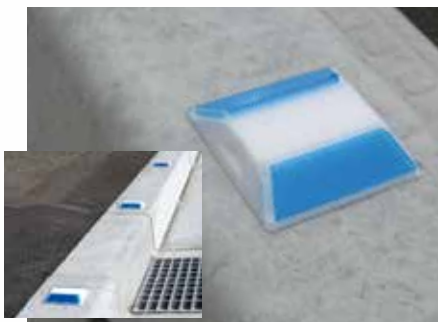
縁石（樹脂製・貼付式）